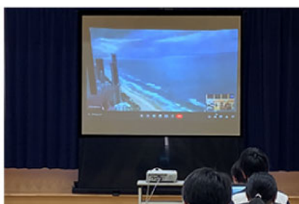
海が見えた瞬間は 生徒から感嘆の声が