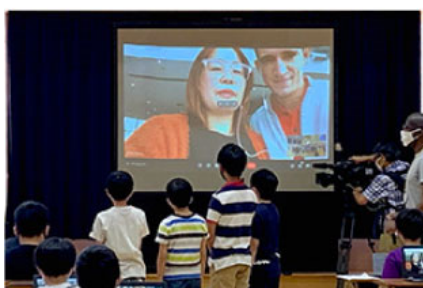
ゴールドコーストの 現地スタッフと交流