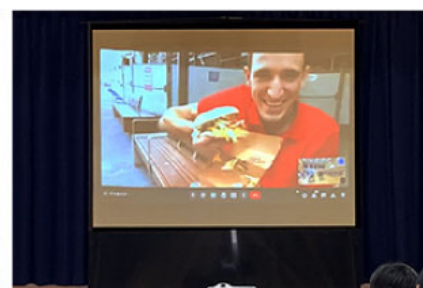
ハンバーガーの 大きさにビックリ