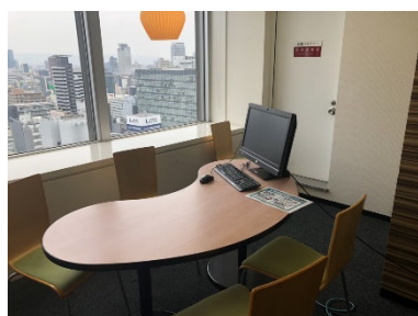
NOVA 駅前教室 (オンラインレッスンルーム) ①