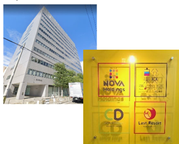
大阪 MM センター (JEI 京橋ビル 7F)