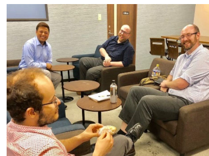
大阪 MM センター内休憩室 (コロナ発生以前)